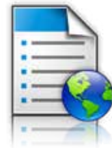
Formularios y favoritos

Las capacidades de soluciones de la serie se combinan con herramientas de gestión de flota de Lexmark, el software empresarial existente y la infraestructura técnica para conformar el ecosistema MFP inteligente de Lexmark. Su adaptabilidad protege a futuro su inversión en tecnología de Lexmark.